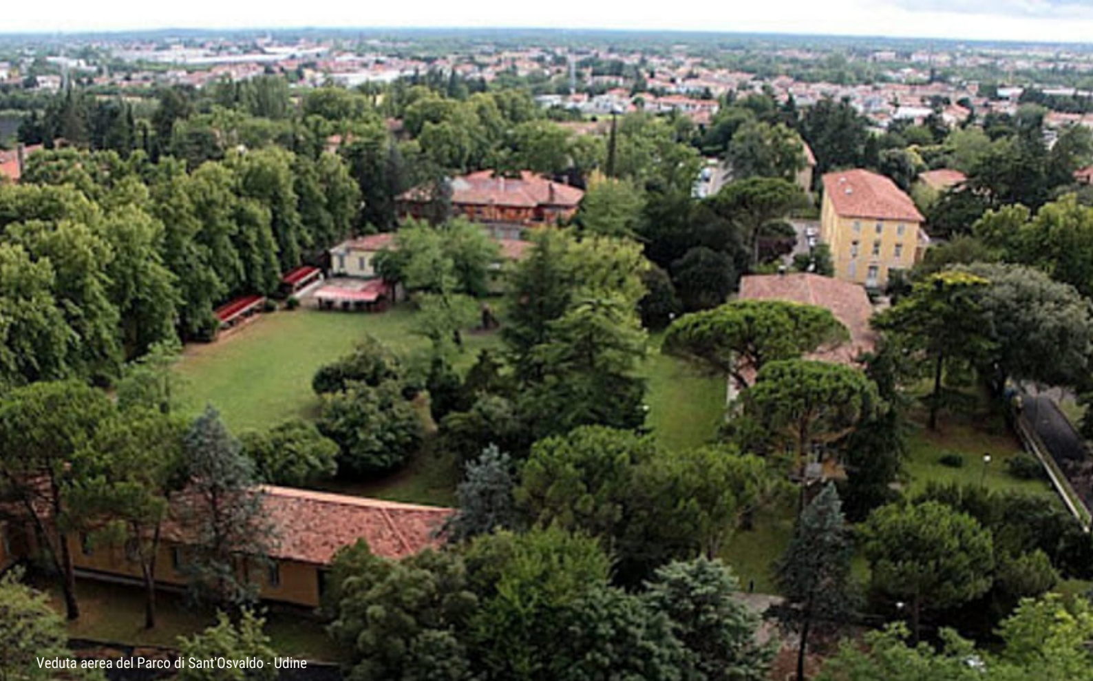
Veduta aerea del Parco di Sant'Oswaldo - Udine