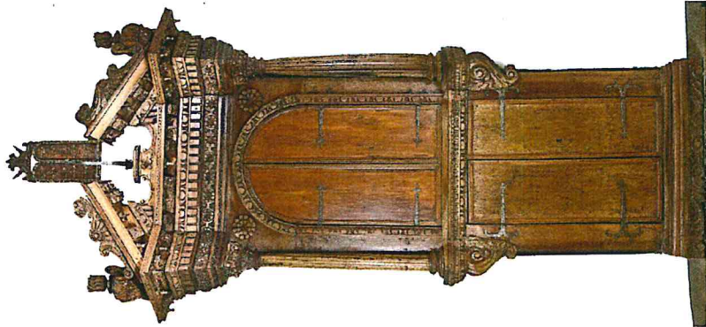
Aron ha-Kodesh dell'oratorio di San Daniele (ora nella Sinagoga di rito italiano a Gerusalemme - riprodotto per gentile concessione del Museo di Arte Ebraica Italiana "U. Nahon", Gerusalemme) Nelle altre pagine: Esterno della Sinagoga di Trieste (© Marino Ierman)

Ufficio Stampa MEIS - Fondazione Museo Nazionale dell'Ebraismo Italiano e della Shoah - Daniela Modonesi