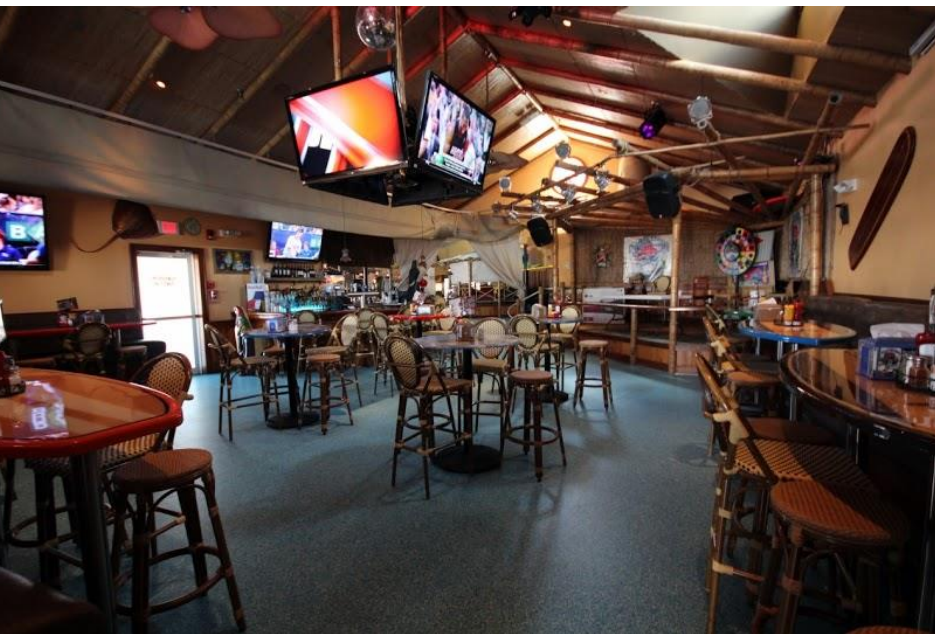
Dead Freddie's Island Grill